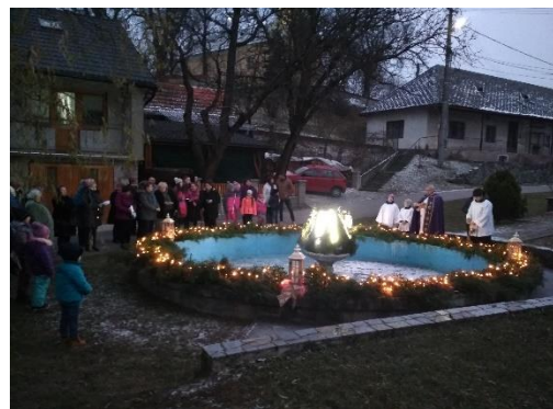
Obrázok 6 Posvätenie adventného venca