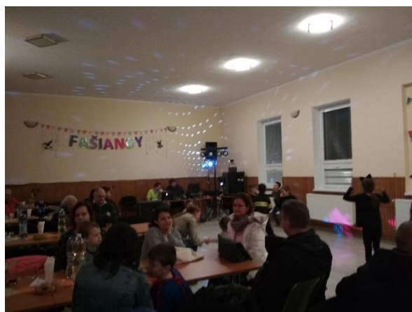
Obrázok 5 Fašiangová zábava

Spoločenský a kultúrny život v obci zabezpečuje obecný úrad v spolupráci s aktívnymi občanmi. Obecná knižnica bola v roku 2012 zlúčená so školskou knižnicou a celý knižný fond prenesený do základnej školy. V obci sa združuje ZO Jednota dôchodcov Slovenska. V obci je kultúrny dom, v ktorom sa organizujú rôzne kultúrne akcie. V roku 2018 sa konala tradičná fašiangová zábava, v októbri zas posedenie pre dôchodcov. V júli sa pri príležitosti Dňa detí cestovalo na kúpalisko do Štúrova. V decembri sa konala vysviacka adventného venca a sv. kríža, po ktorej bolo v kultúrnom dome pripravené pre účastníkov občerstvenie a pre všetky deti priniesol sladký darček sv. Mikuláš.