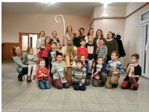
Obrázok 7 Mikuláš s deťmi

Ľudové tradície z obce pomáha zachovávať aj FSK Badínčanka, ktorá vznikla v osemdesiatych rokoch minulého storočia.