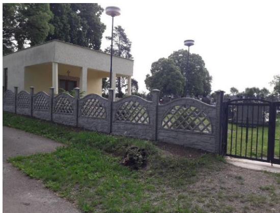
Obrázok 8 Oplotenie cintorína pred a po rekonštrukcii