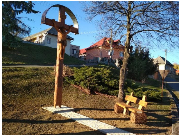
Obrázok 10 Rekonštrukcia sv. kríža pred a po rekonštrukcii