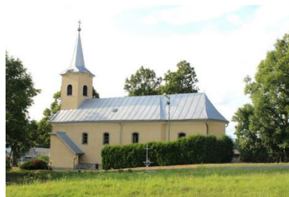
Obrázok 3 Rímskokatolícky kostol sv. Michala

Vnútorňú časť kostola tvorí jedna loď na priečelí s oltárom, na ktorom vyniká obraz sv. Michala s anjelmi v boji proti satanovi. Po bokoch obrazu sa nachádzajú sochy sv. Petra a sv. Pavla. Na bočných stenách kostola sú sochy Panny Márie, Sv. Terézie, Ježiša a sv. Antona. Na chóre sa nachádza organ. V roku 2017 sa interiér kostola nanovo vymaloval. V roku 2018 sa začala obnova oltára a ďalších prvkov.