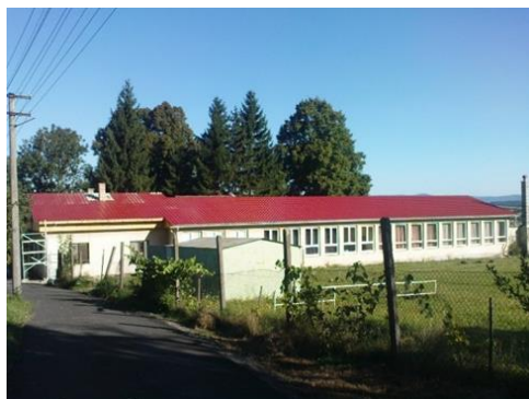
Obrázok 4 Budova ZŠ Dolný Badín